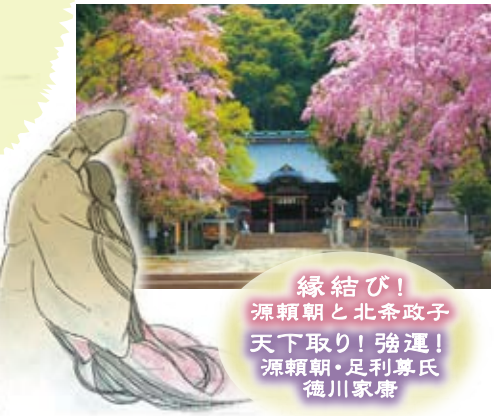
縁結び！ 源頼朝と北条政子 天下取り！強運！ 源頼朝・足利尊氏 徳川家康

頼朝と政子のロマンスに始まる縁結びの神。伊豆山神社の始まりは、その昔、相模国唐浜に流れ着いた神鏡を松葉仙人が伊豆山に祀り、走湯権現(はしりゆごんげん)と伝承したといわれています。その後、蛭ヶ小島に流された源頼朝が約20年にわたる流人生活の間、伊豆山走湯権現の別当密蔵院(みつごんいん)の僧、阿闍梨覺淵(あじゃりかくえん)に師事。走湯の神威と衆徒の勢力を頼みに源氏再興の旗を掲げ、鎌倉幕府の開幕後も伊豆山神社を関東の総鎮守として厚く信仰。箱根権現と走湯権現をめぐる二所詣を行なったことでも有名です。また頼朝とその妻、北条政子との結婚にまつわる逸話から伊豆山神社は縁結びの神として知られるようになり、今日でも多くの参詣者が訪れています。